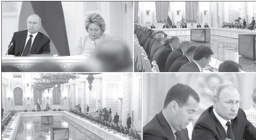
«Наличие дорог хорошего качества имеет чрезвычайно важное значение...»

В Георгиевском зале Кремля под председательством Президента РФ Владимира Путина прошло заседание Государственного совета, посвящённое вопросам развития сети автомобильных дорог общего пользования и обеспечения безопасности дорожного движения. В работе совещательного органа принял участие губернатор Ивановской области Станислав Воскресенский.