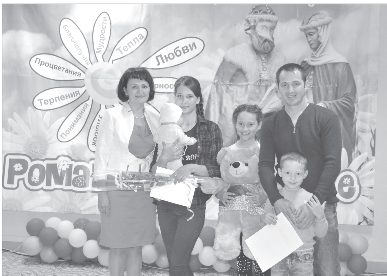
Семья Романовых. 8 июля отмечается День семьи, любви и верности. Поздравления читайте на стр. 4

В РАМКАХ ПРАЗДНОВАНИЯ ДНЯ СЕМЬИ, ЛЮБВИ И ВЕРНОСТИ