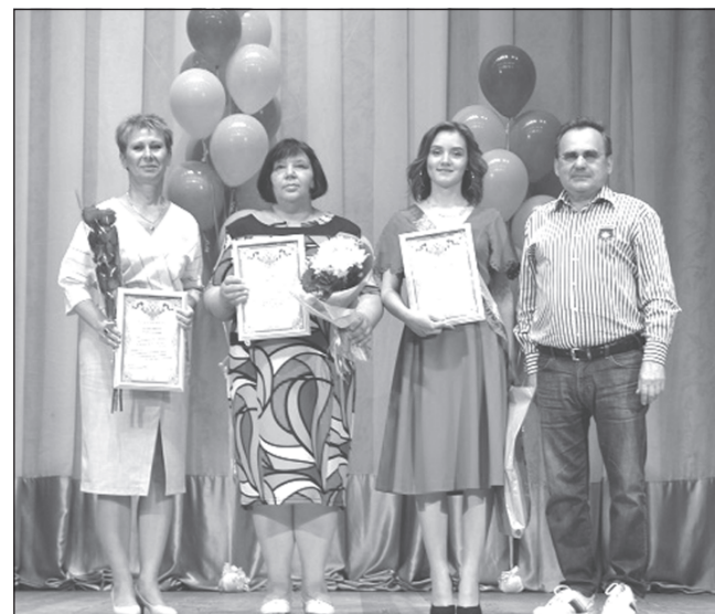
Вручение благодарностей областной Думы на выпускном.

- Я была подписана на множество групп «ВКонтакте», любила особенно страничку «История в вопросах», там очень часто отвечала на