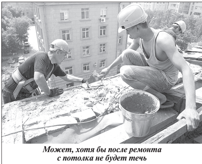
Может, хотя бы после ремонта с потолка не будет течь

В истекшем году прокуратурой Октябрьского района г. Иваново рассмотрено 10 обращений жителей региона на незаконные действия НО «Региональный фонд капремонта многоквартирных домов Ивановской области», из них 7 признаны обоснованными, внесено 5 представлений с требованием устранить выявленные нарушения.