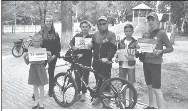
Наша молодёжь выбирает здоровье.

Наркомания - эпидемия нашего века, которая распространяется, в том числе, и на детей. Причем более всего «заражению» подвержены подростки. А пропаганда здорового образа жизни и вреда наркотиков среди подростков - это основное средство борьбы с ней.