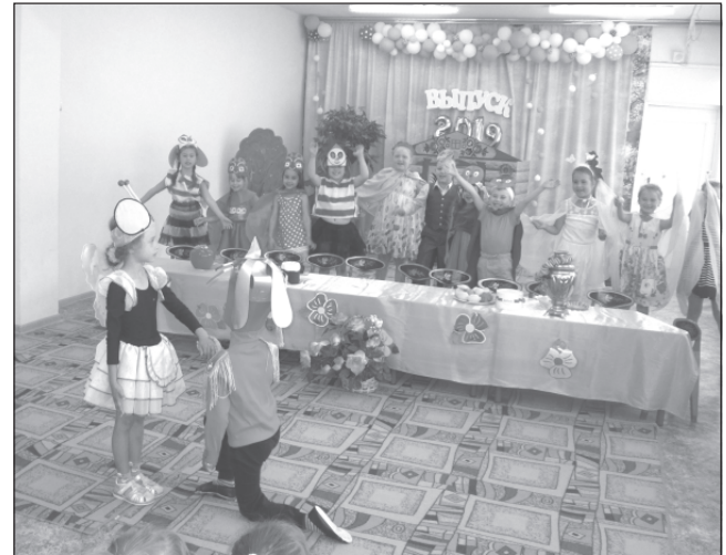
Ребята стараются передать образ своих героев.

Старались, волновались, но смогли передать образ каждого персонажа, поэтому представления получились яркими, выразительными, красочными и поучительными. Зрители хлопали, радовались, переживали за героев сказок, но у каждого спектакля был счастливый конец, а общая песня о дружбе и веселый танец подняли