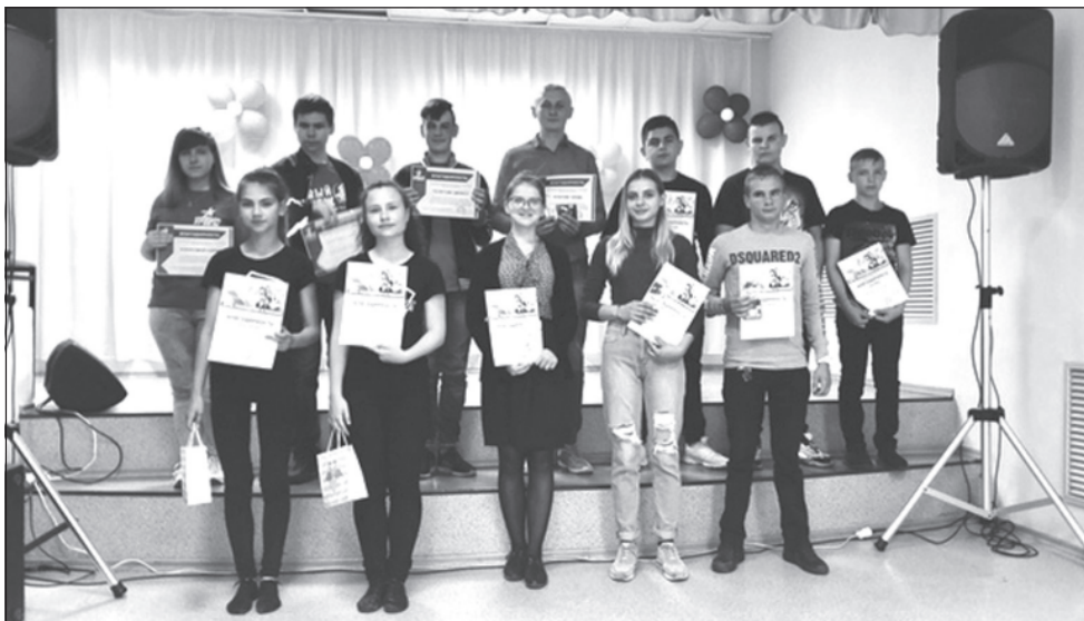
Грамоты - всем участникам семейного праздника.

Приволжане в очередной раз доказывают, что весело может быть при любой погоде. Главное — это теплая атмосфера конкурсов и сплоченность каждого коллектива.