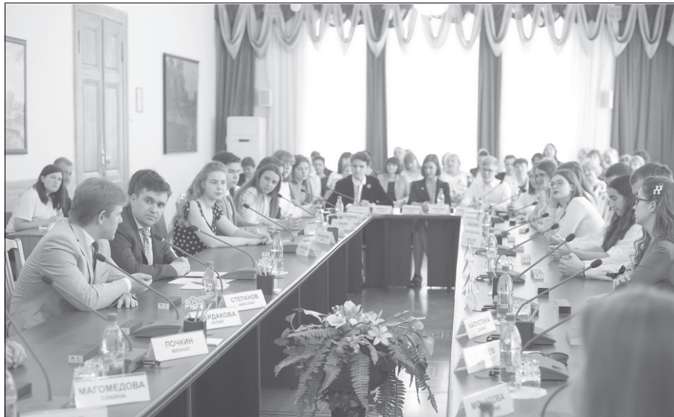
В ходе встречи с главой региона выпускники поделились своими планами.

Среди тех, кто показал отличные результаты на ЕГЭ — выпускники школ Иванова,