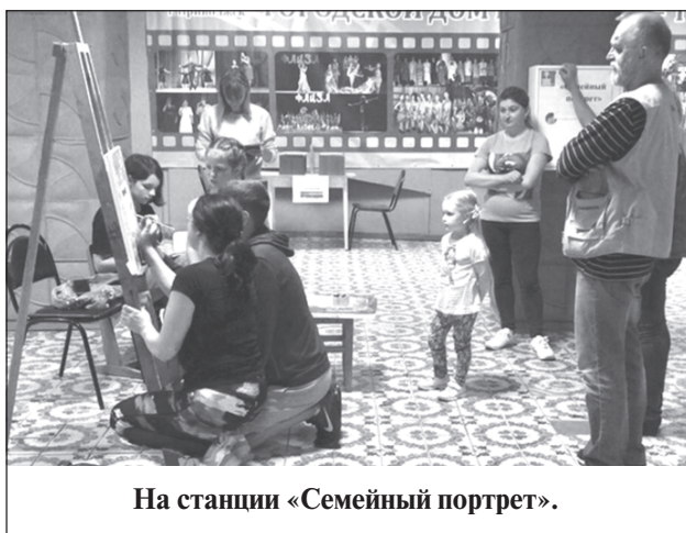
На станции «Семейный портрет».

В целом, получилось очень веселое и милое мероприятие. А учитывая все трудности, которые пришлось преодолеть организаторам эстафеты при подготовке к празднику, можно сказать, что со своей задачей они справились на отлично. Но в следующий раз хотелось бы более сложных состязаний. Опыт говорит, что приволжане справятся с любыми конкурсами. Ещё раз большое спасибо руководству Дома культуры за этот праздник бодрости духа и хорошего настроения.