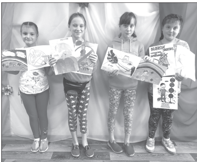
Несмотря на юный возраст, ребята поняли всю пагубность вредных привычек.

Ребята из семей, курируемых отделением профилактической работы с семьей и детьми ЦСО, выполнили творческие работы на тему антинаркотической пропаганды.