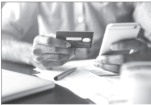
Бдительность - наше главное оружие

В новостных лентах ивановских СМИ каждый день появляется информация о выявлении очередного случая дистанционного мошенничества.